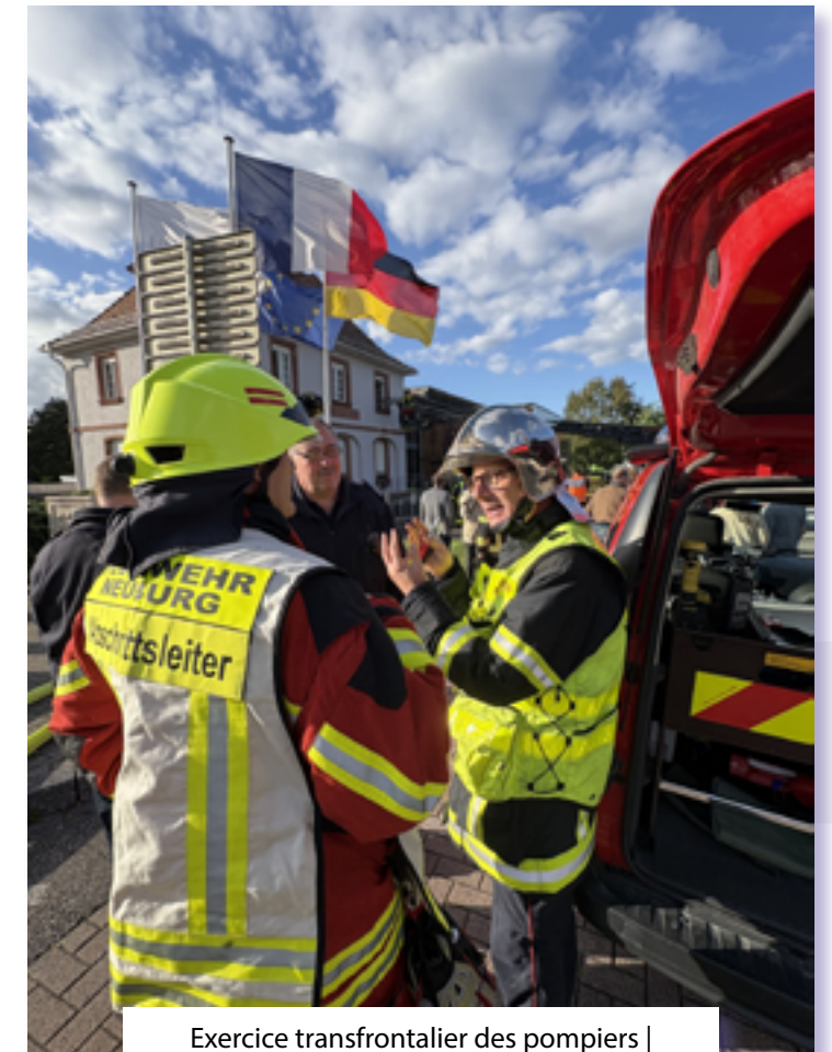
Exercice transfrontalier des pompiers | Grenzüberschreitende Feuerwehrrübung