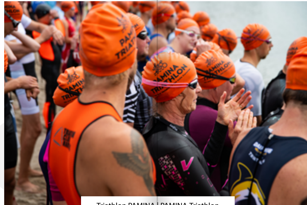
Triathlon PAMINA | PAMINA-Triathlon