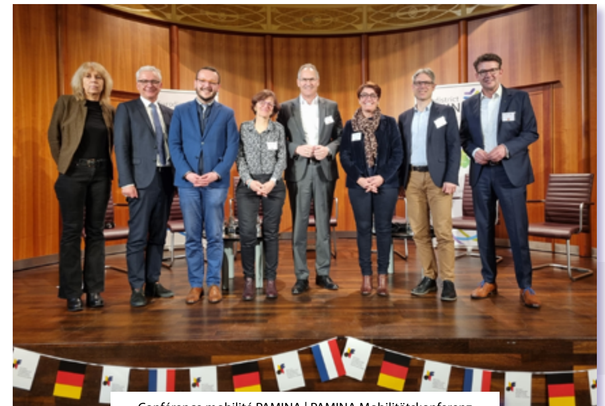
Conférence mobilité PAMINA | PAMINA Mobilitätskonferenz