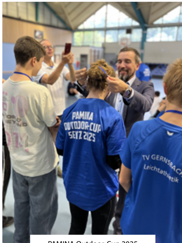
PAMINA Outdoor-Cup 2025