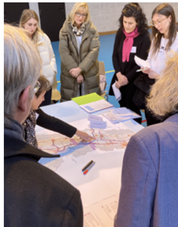
Conférence sur l'aménagement de territoire du Rhin supérieur | Conferenz zum Raumkonzept Oberrhein