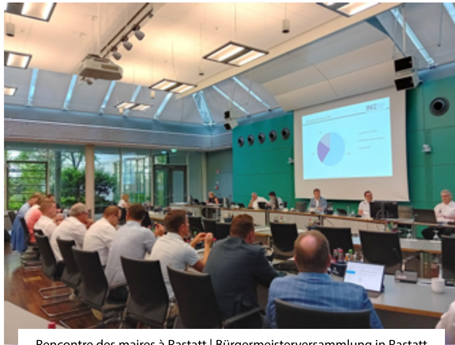
Rencontre des maires à Rastatt | Bürgermeisterversammlung in Rastatt